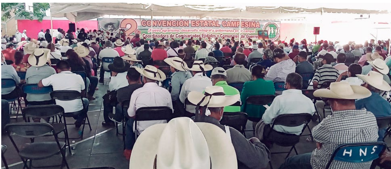
Imagen 5. La Segunda Convención Campesina

La Segunda Convención Campesina, realizada el 8 de diciembre del 2021, reunió a 1,400 participantes del estado de Guerrero y de otros 12 estados.