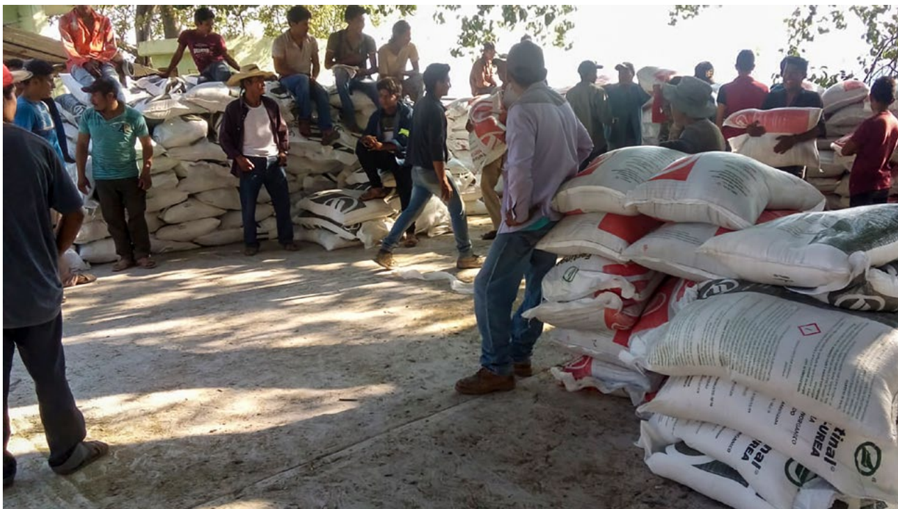
Imagen 1. La distribución del fertilizante en Guerrero

El programa Fertilizantes para el Bienestar subsidia con insumos químicos a campesinos productores de granos básicos.