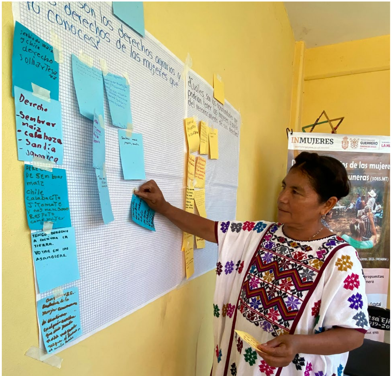
Imagen 3. Mujeres ejidatarias y comuneras son titulares de derechos agrarios

Mujeres rurales se capacitan y se organizan para ejercer sus derechos agrarios.