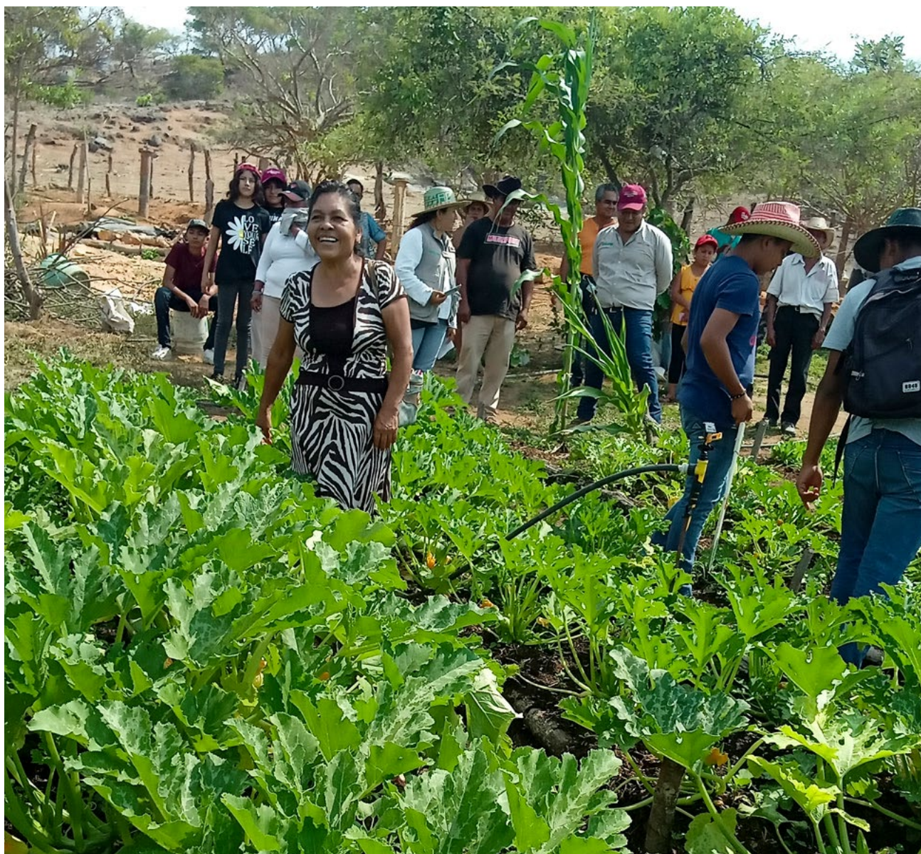
Imagen 2. Escuela de campo

Campesinos y campesinas participan en una escuela de campo organizada por la Estrategia de Acompañamiento Técnico en el programa Producción para el Bienestar.