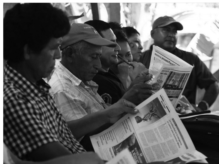
Campeños informándose, antes de que inicie una de las reuniones del MCPASXXI