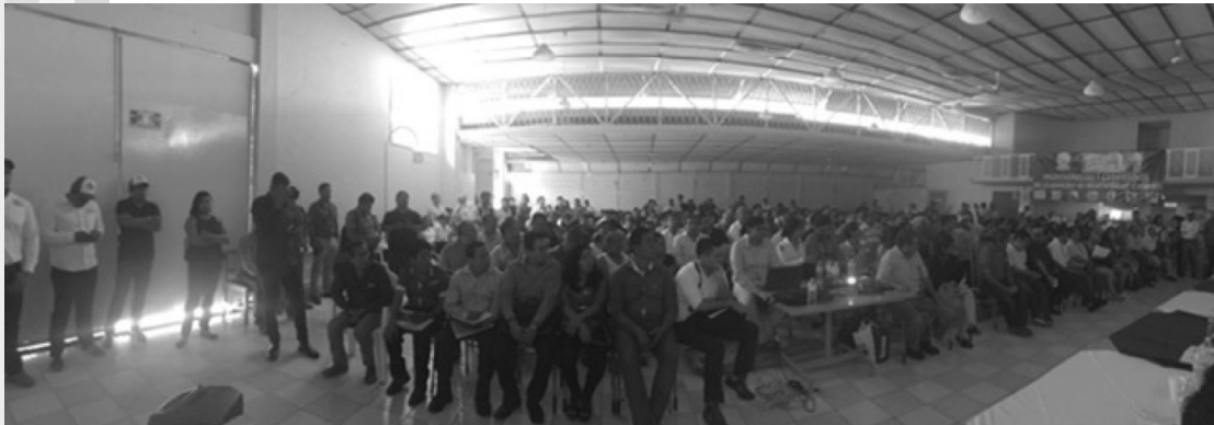
Zona Centro (Chilpancingo)