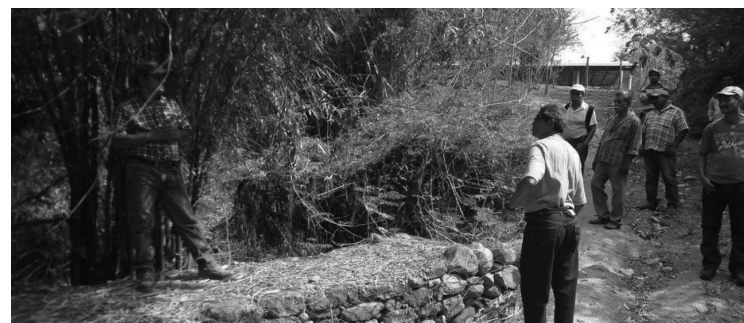
La regularización de la tenencia de la tierra, uno de los muchos rezagos agrarios causantes de conflictos en ejidos y comunidades.