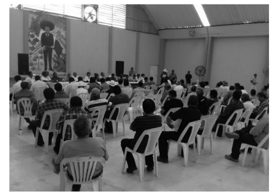
Zona Norte (Iguala)