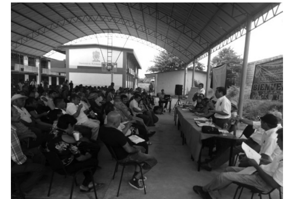
Costa Grande (Atoyac de Álvarez)