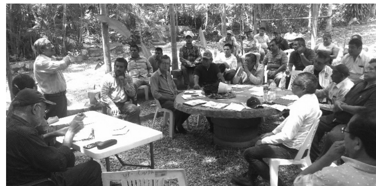
Una de las reuniones de la Comisión Coordinadora Estatal, en Ceprodites, para organizar el Congreso.

por la Salud (ATS), 38. Red de Agrónomos de Guerrero (Redagro), 39. Unidad de Colonias, Pueblos y Ejidos de Acapulco (Ucope), 40. Federación de Cooperativas Pesqueras, Agrícolas, Agroindustrias de Costa Chica (FECOPAACCCH), 41. Unión de Pueblos para la Autogestión Colectiva, (UPAC), 42. Alianza de Organizaciones Sociales de La Sierra del Estado de Guerrero, 43. Profesionistas del Sector Agropecuario, 44. Los Pueblos amuzgo, mixteco, tlapaneco y náhuatl de la Costa Chica SPR, 45. Productores de los Cuatro Pueblos SPR, 46. Productores de miel multiflora SPR, 47. Miel amuzga de Zacualpan SC, 48. Haden del mar SPR, 49. Unión de Ejidos y Comunidades de Turismo de Naturaleza de la Zona Norte de Guerrero, 50. Consultores Asociados para la Promoción del Desarrollo Regional S.C. 51. Consultoría para la Investigación y Estudios Sociales (CIES), 52. Consultores Asociados para la Promoción del Desarrollo Regional, 53. Consejo Regional de la Costa Grande, 54. Movimiento al Socialismo, 55. Grupo Sierra, 56. Medios Progresistas, 57. Unión Nacional de Trabajadores Agrícolas (UNTA), 58. Acción Ciudadana, 59. Concertación Campesina, 60. Productores de Maíz de la Costa Chica (Promacoch), 61. Combinado Agroindustria de la Costa Grande (CAI), 62. Unión Nacional