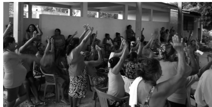
Votación a mano alzada para elegir a integrantes de Comité de Desarrollo Comunitario (CDC)

De esta forma, el 20 de julio se realizó un encuentro campesino estatal para planificar las acciones a seguir en materia de organización y propuestas para rescatar el campo guerrerense. A partir de aquí se realizaron 8 Encuentros Campesinos Regionales en los cuales se designaron Comisiones Coordinadoras Regionales, mismas que realizaban la programación de Asambleas Municipales, a partir de las cuales se planificaba la realización de asambleas comunitaria para elegir un Comité de Desarrollo Comunitario encargado de planear de manera democrática