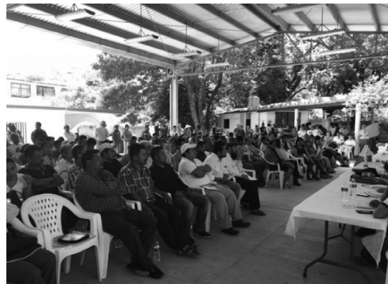
La Montaña (Tlapa)