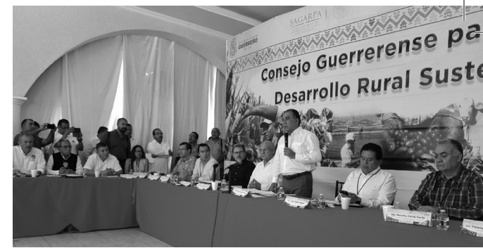
El Consejo Guerrerense para el Desarrollo Rural Sustentable (CGDRS), que –según la Ley– debería ser el órgano rector para la transformación del campo funciona esporádicamente, de manera protocolaria y sólo para validar las decisiones gubernamentales.