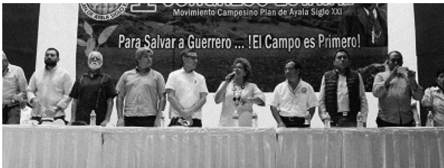
Durante el acto de clausura del Congreso

Por todo lo anterior, hoy miércoles 21 de noviembre de 2018, siendo las 17 horas me es grato declarar formalmente clausurados los trabajos de este Primer Congreso Estatal del Movimiento Campesino Plan de Ayala Siglo XXI.