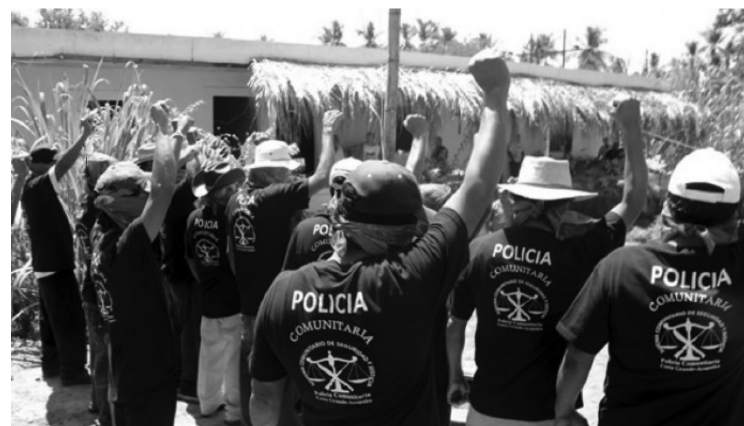
Policías comunitarias, regularizadas y con el aval de la asamblea, el camino para la pacificación en Guerrero