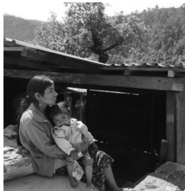
Mejorar la calidad de vida en el campo, un pendiente histórico.