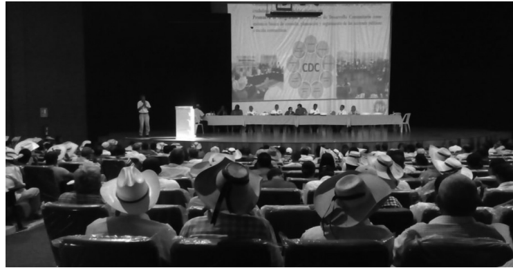
Tierra Caliente (Cd, Altamirano)