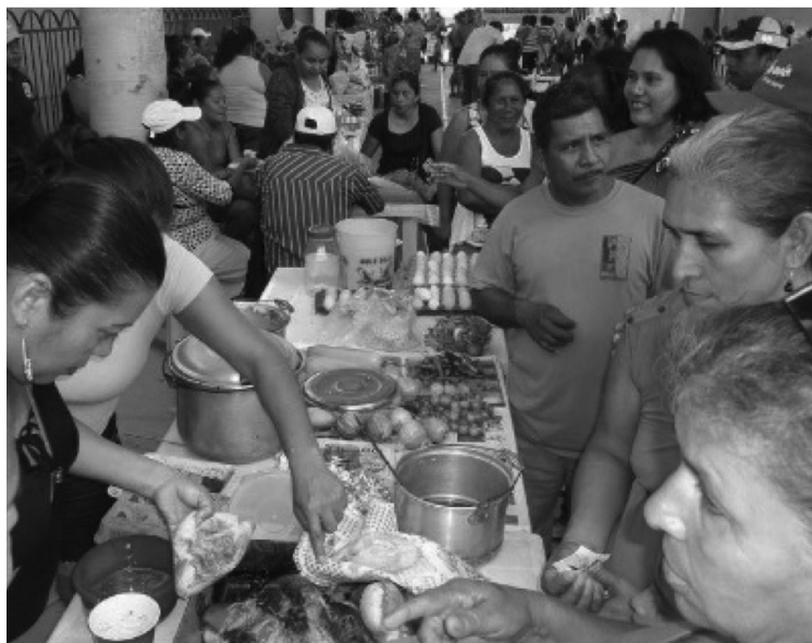
Los tianguis campesinos, una expresión de economía social y solidaria.

En el campo no hay suficiente organización para llegar a los mercados. No se cuenta con financiamiento ni infraestructura para almacenamiento, transporte y agregación de valor a la producción rural. Tampoco hay incentivos para el productor, ni mercados adecuados.