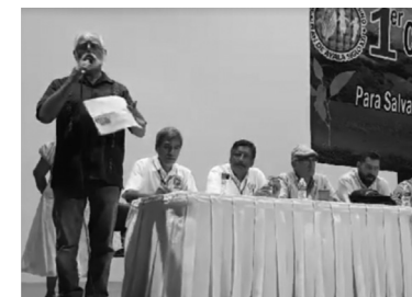
El mensaje inaugural de Álvaro Urreta, enlace federal para el diálogo y la reconciliación en Guerrero.

Entonces esta es la Cuarta Transformación. Aquí estamos todos. Tenemos que actuar con humildad, con sencillez, con coordinación, con participación, con escucha y juntos, colectivamente apoyar a Andrés López Obrador en estos próximos 6 años que van a ser muy interesante, para la transformación del país.