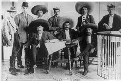
Revolucionarios de Ayala.

Emiliano Zapata. Ayoxustla, Puebla. 1911.