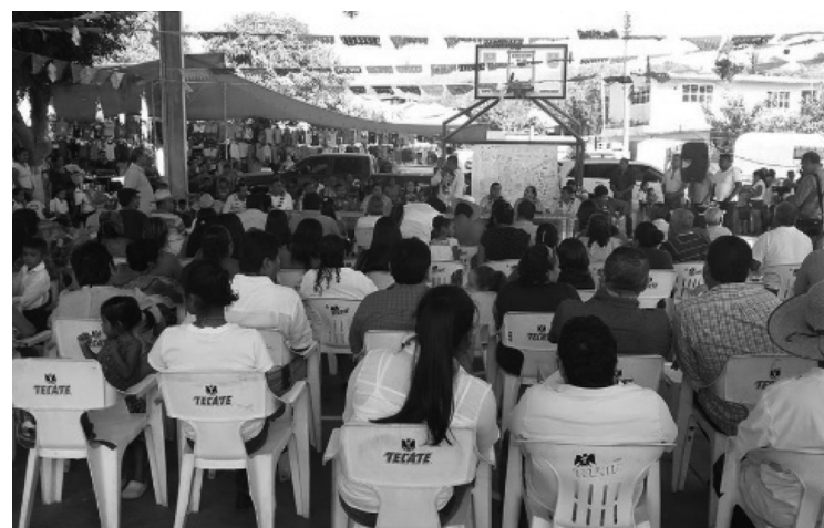
Cabildo abierto itinerante en la localidad de Ocotillo, Coyuca de Benítez. Un mecanismo de participación ciudadana.