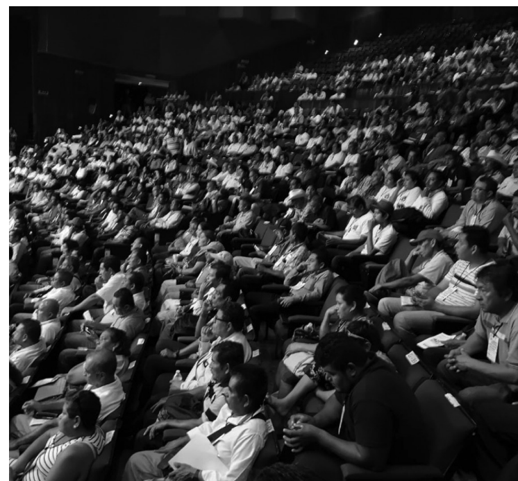
Panorámica de los congresistas en la sesión plenaria inaugural

Al culminar este evento tenemos que volver a nuestras regiones con el ánimo de organizar Comités de Desarrollo Comunitario que serán el mecanismo responsable de elaborar el programa de trabajo de su comunidad, y garantes de que los programas gubernamentales se apliquen con equidad y transparencia. En la era de la Cuarta Transformación ya no habrá cabida a falsos líderes que gestionan y mochan a los beneficiarios sin su consentimiento; a los que hablan en nombre de la gente sin consultarlos... Llegó la hora de que la gente hable por sí misma, y a través de sus legítimos representantes.