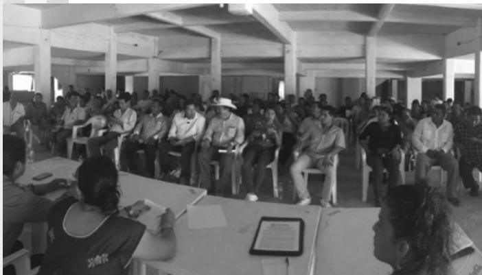
Costa Chica (Marquelia)