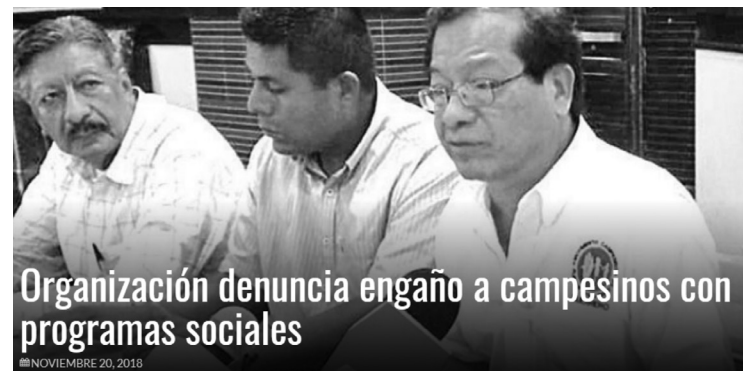
Organización denuncia engaño a campesinos con programas sociales

Durante la conferencia, demandaron mayor apoyo de las dependencias encargadas de los programas del campo: “no nos llegan a los que trabajamos la tierra, se quedan en manos de funcionarios corruptos e intermediarios usureros”.