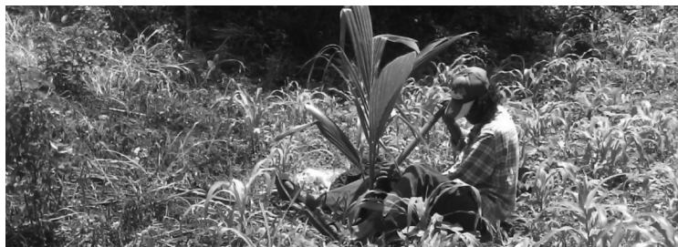
Más que por el subsidio gubernamental, el campo todavía da para sobrevivir gracias a la generosidad de la tierra y a la laboriosidad del campesino.