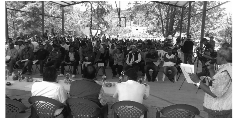
La Sierra (Filo de Caballos)