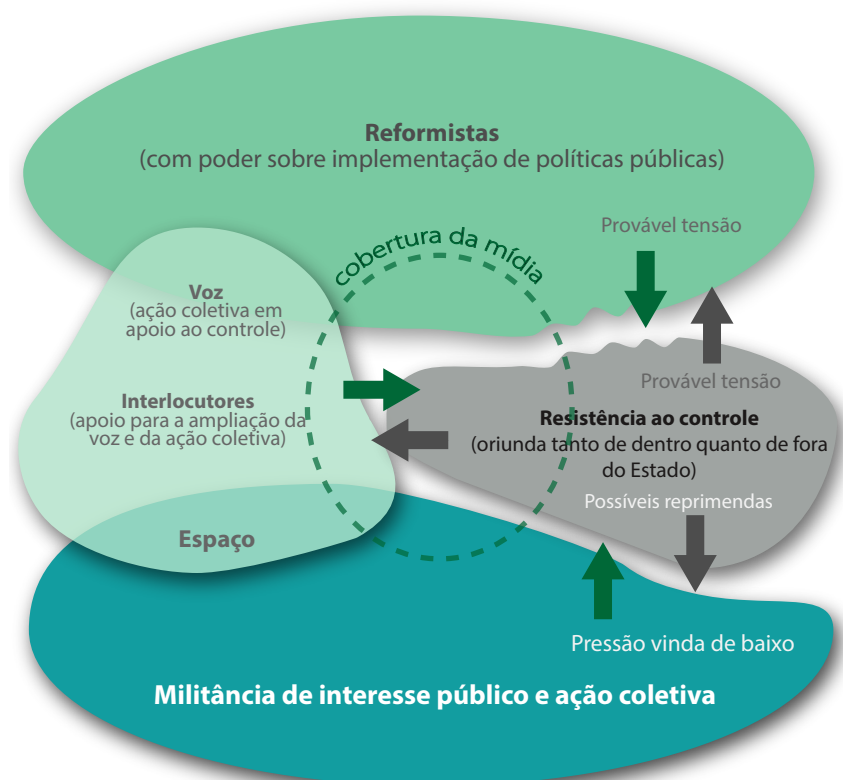
FIGURA 2 – A ESTRATÉGIA SANDUÍCHE: ABERTURA DE CIMA ENCONTRA A MOBILIZAÇÃO DE BAIXO